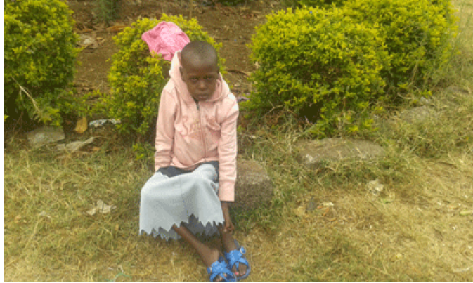
Dans le jardin de l'Hopital à Loitokitok

Une pensée pour cette petite victime innocente. MAA fait ce qu'il peut, mais il ne peut pas tout.