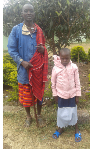
Avec son oncle, un massai typique