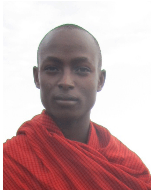
Loidimu, 22 ans, cherche une bourse pour étudier "food and nutrition"